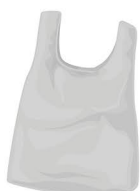
BUSTA DI PLASTICA