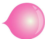
GOMMA DA MASTICARE